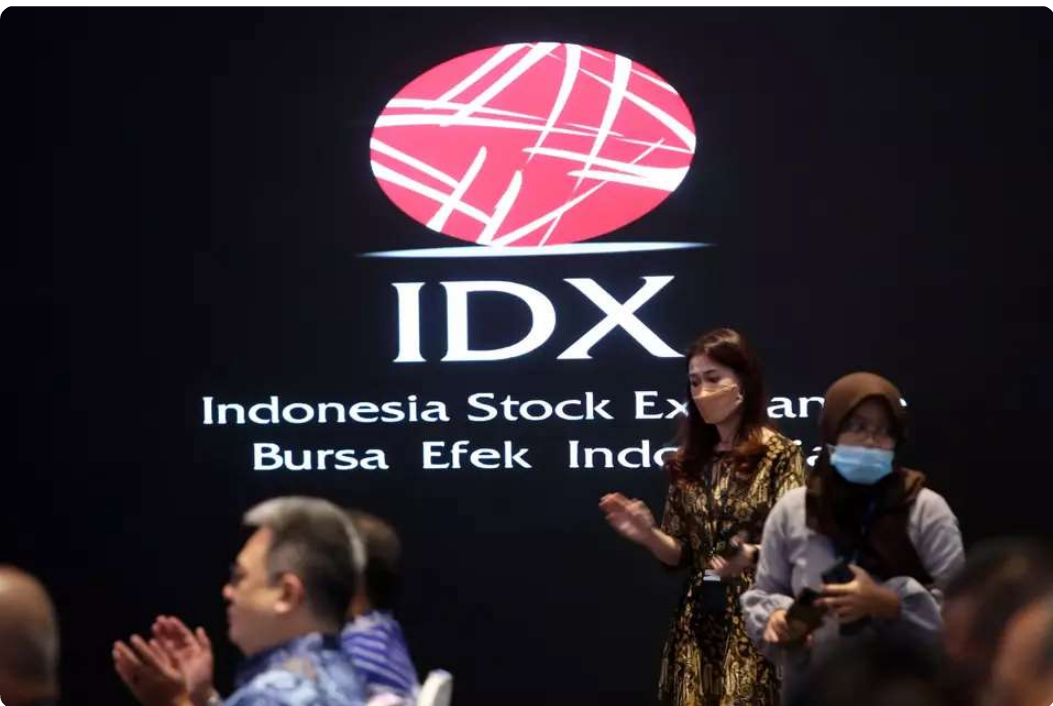
Sejumlah karyawan beraktivitas di Bursa Efek Indonesia (BEI), Jakarta.

JAKARTA, investor.id - Saham PT Mitra Pack Tbk (PTMP) melesat 13,82% pada perdagangan 16 Februari 2024 pekan lalu ke Rp 280. Sebanyak 271,28 juta saham ditransaksikan, frekuensi 38.820 kali, dan nilai transaksi Rp 71,01 miliar. Dalam satu pekan terakhir, saham ini melejit 22,81%.