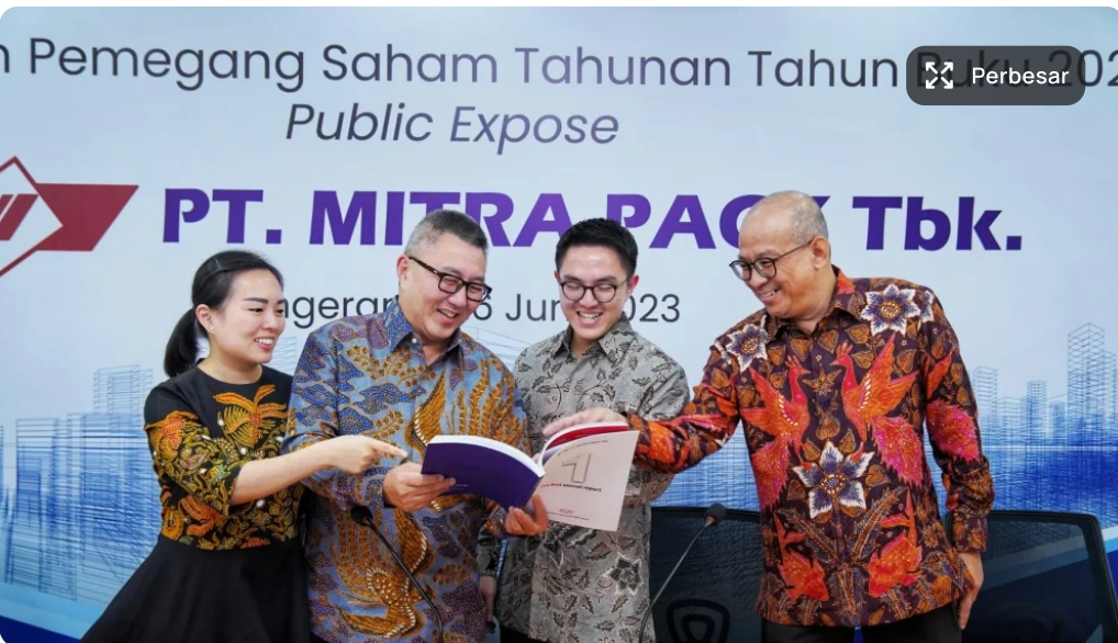
PT Mitra Pack Tbk. (PTMP) menargetkan pertumbuhan pendapatan 15 persen-20 persen pada 2023.

Aziz Rahardyan - Bisnis.com Senin, 16 Oktober 2023 10:07:59 Share f t w in v l